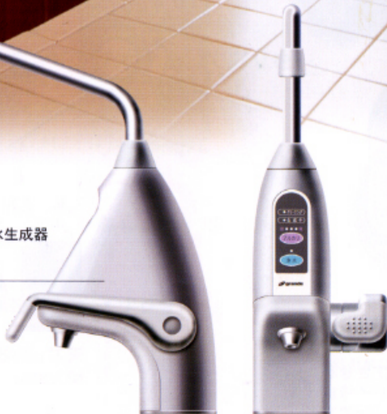
ビルトイン型 アルカリイオン水生成器 e-グランデ